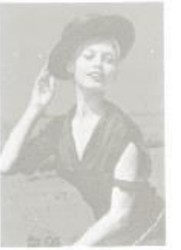
D-25 Brigitte Bardot