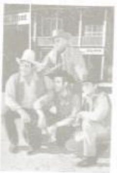
349 Familien Cartwright