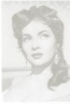
A-127 Gina Lollobrigida