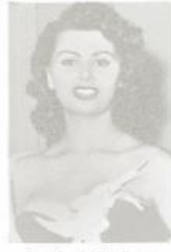
D-110 Sophia Loren