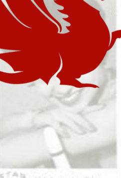
STAR SLICK 114 Anita Lindblom Festans