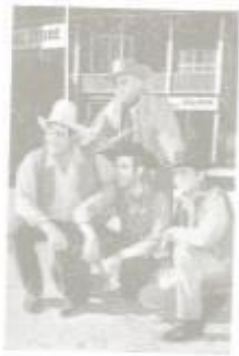
349 Familien Cartwright