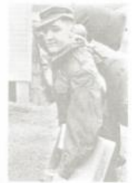
D-85 Elvis Presley