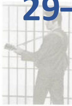
D-45 Elvis Presley