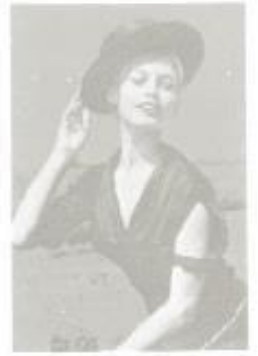
D-25 Brigitte Bardot