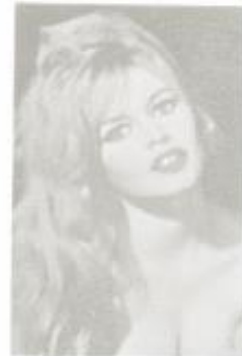
D-99 Brigitte Bardot