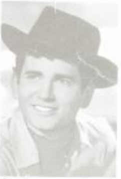
STAR SLICK 347