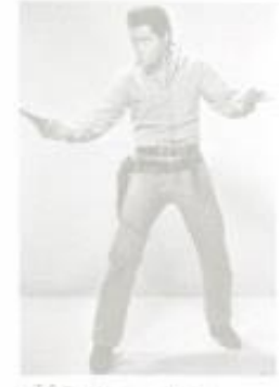
STAR SLICK 333 Elvis Presley Lunde 1. 2. 3. 4.