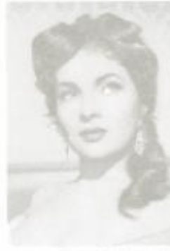
A-127 Gina Lollobrigida