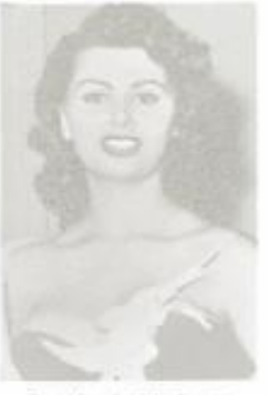
D-110 Sophia Loren