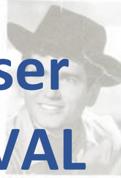
STAR SLICK 347