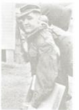
D-85 Elvis Presley