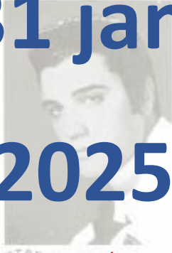
STAR SLICK 114 Elvis Presley Festans