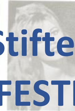
D-99 Brigitte Bardot