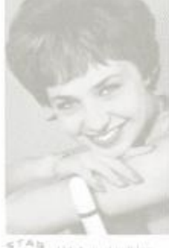
STAR SLICK 114 Anita Lindblom Festans